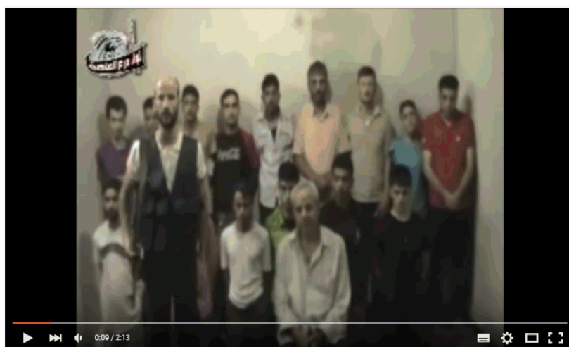
Syrian Insurgents Execute Prisoners Then Blame The Army

C'è poi un'altra motivazione: l'"Operazione Caesar" (che si colloca sull'onda di altre gravissime manipolazioni dei fatti, in altri contesti, come, ad esempio,, le " fosse comuni di Gheddafi " o quelle di Timisoara ), al pari di alcune foto sulle foibe capovolge la realtà, trasformando le vittime in carnefici e i carnefici in vittime. E prima di andare avanti nella lettura di questo report, vale la pena di guardare questo breve video , prodotto da un gruppo di attiviste e attivisti siriani – SyrianGirlpartisan - che cercano, faticosamente, di fare controinformazione.